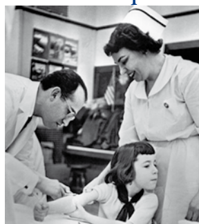
Dr Jonas Salk avec l'un des premiers enfants vaccinés contre la polio

Avril marque la 60 ème anniversaire de l'annonce que le vaccin inactivé de Jonas Salk (VPI) était sûr et efficace. Son oeuvre a joué un rôle considérable pour assurer un monde sans polio.